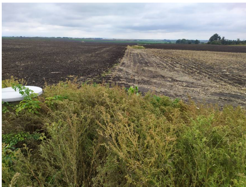
Obr. 2 Pohled na řešené území