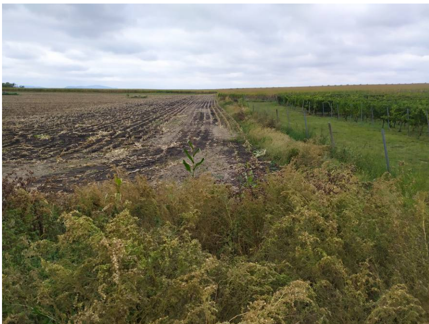
Obr. 1 Pohled na řešené území